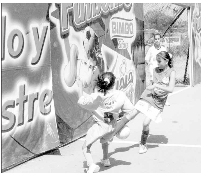
Garra y corazón habrá de presenciarse dentro del tradicional Torneo del Futbolito Bimbo.

La Tercera Etapa, Regional, en los estados que participan más de una ciudad se jugará el 21 y 22 de junio una eliminatoria directa, para obtener un campeón por estado.